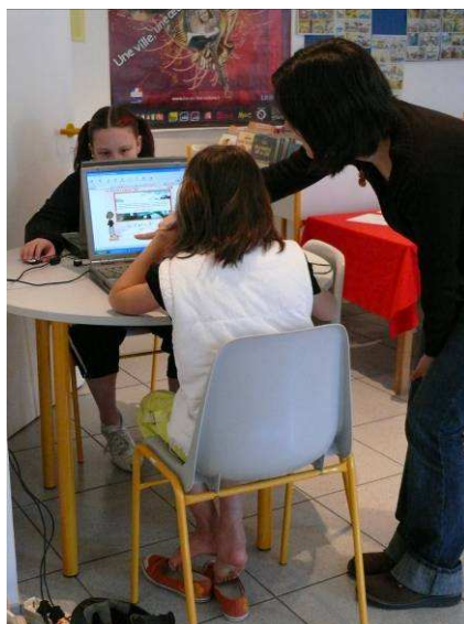
Le réseau des bibliothèques a organisé des animations multimédia sur le thème de l'eau.