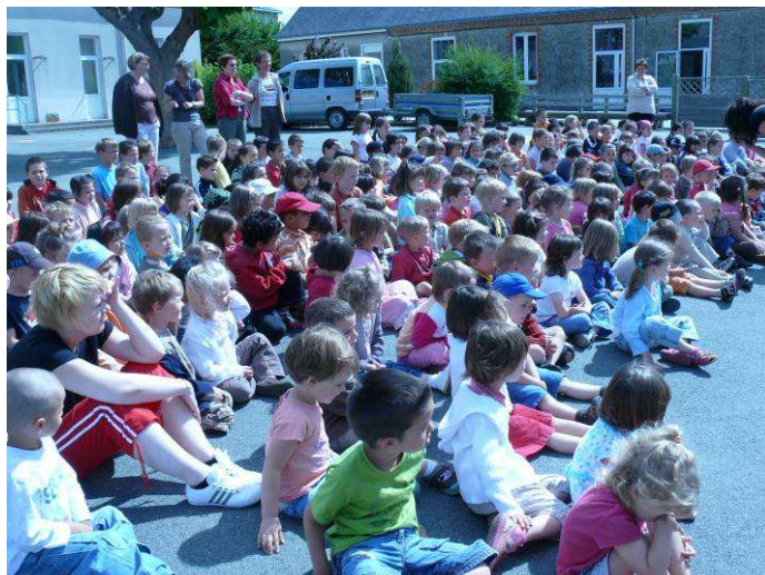
Concert marathon 2008 : les élèves de l'école de musique passe jouer dans les écoles du territoire.