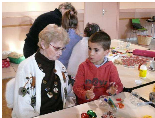
Rencontre des enfants du personnel du SSIAD avec les patients du service